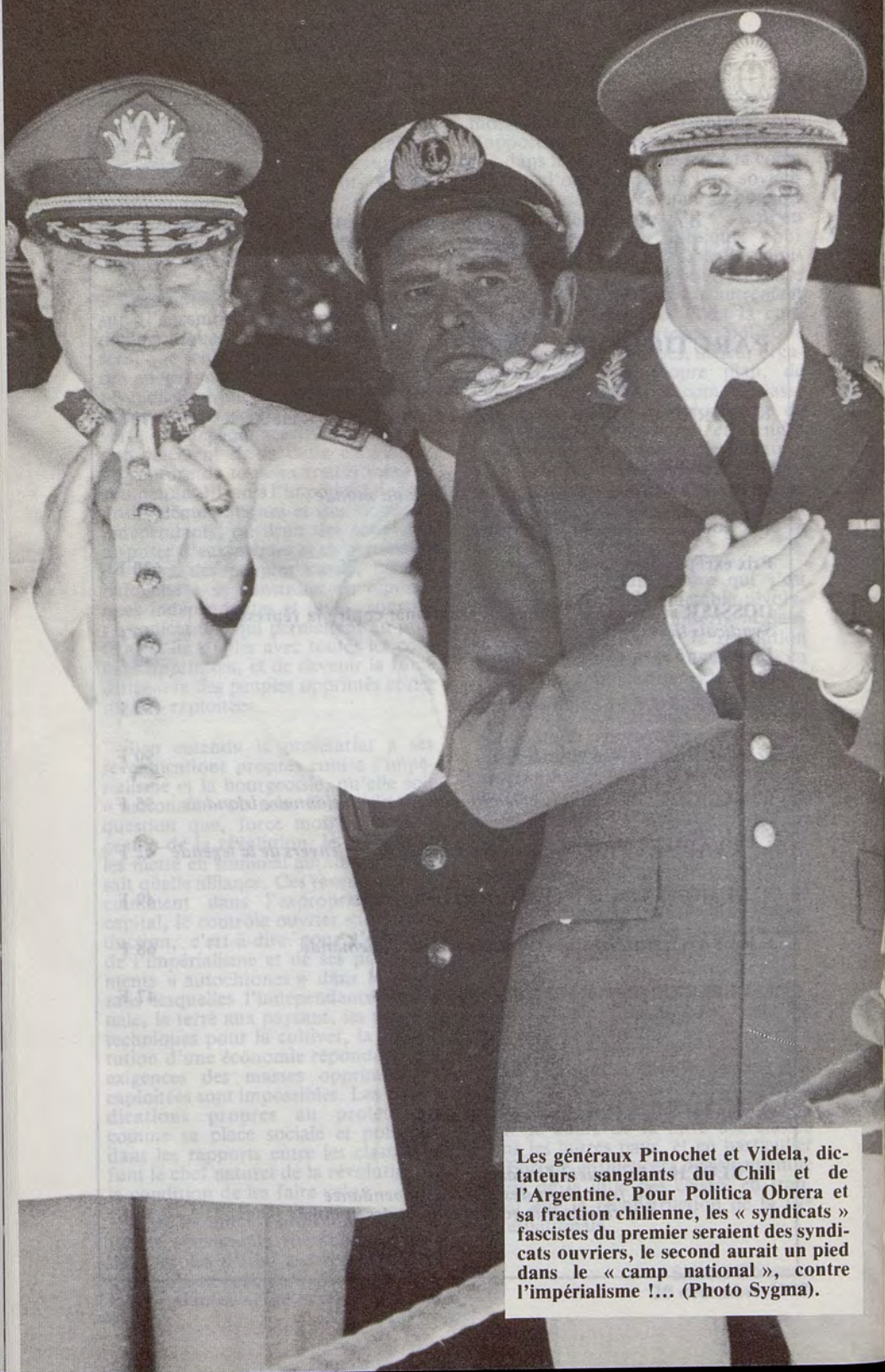
Les généraux Pinochet et Videla, dictateurs sanglants du Chili et de l'Argentine. Pour Política Obrera et sa fraction chilienne, les « syndicats » fascistes du premier seraient des syndicats ouvriers, le second aurait un pied dans le « camp national », contre l'impérialisme !....