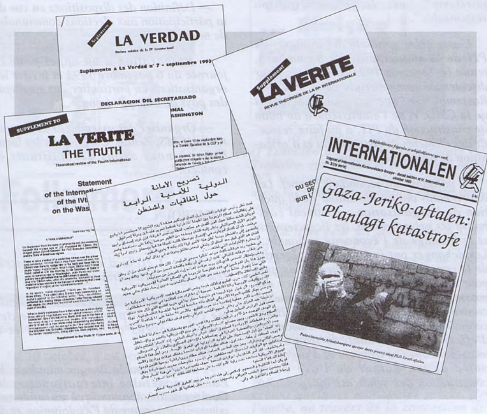
La déclaration du secrétariat international de la IV e Internationale sur les "accords de Washington" concernant la Palestine a été publiée en anglais, français, espagnol, arabe, portugais, allemand, danois, italien.

Le prochain numéro de La Vérité rendra compte des travaux du conseil général.