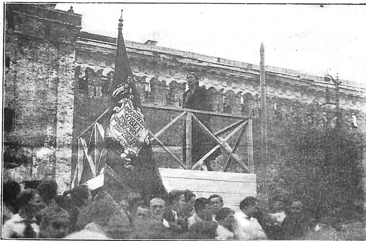
LA REVUE DU 17 JUIN A MOSCOU. — Discours d'une Déléguée des Femmes de l'Orient.