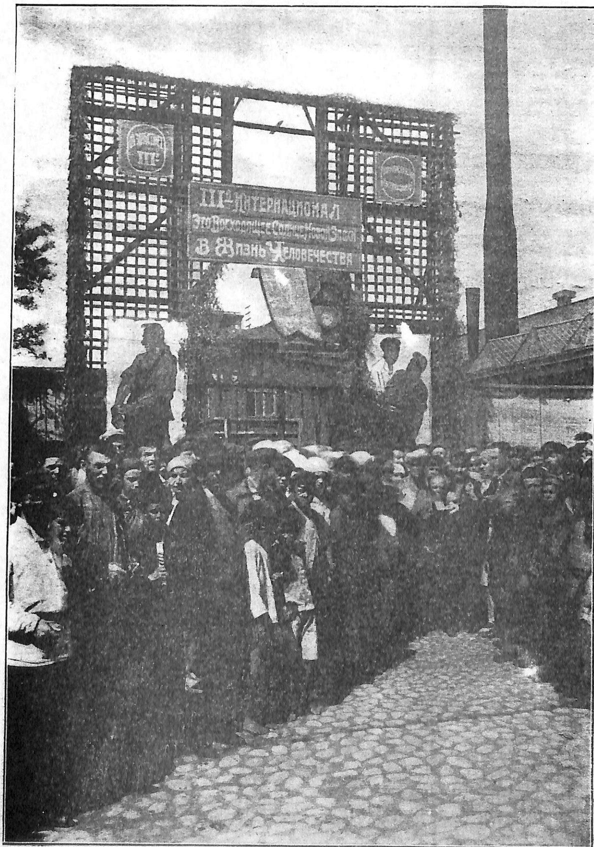
La Vie en Russie. — Entrée des Usines Poutilov