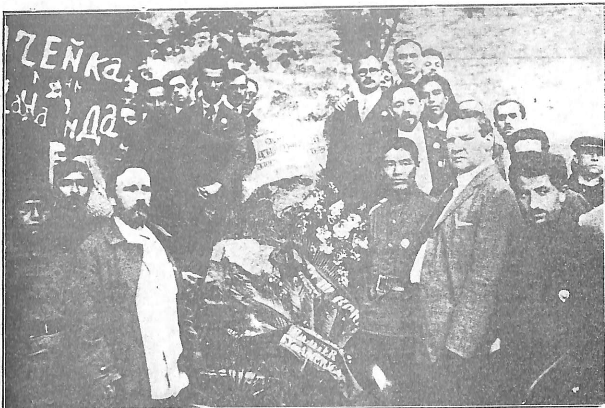
DANS LA RUSSIE DES SOVIETS. — Kamenev prononçant un discours sur la tombe du communiste américain John Reed.