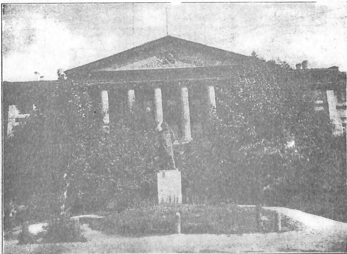
A MOSCOU. — L'Institut Smolny. (Au premier plan la statue de Karl Marx)