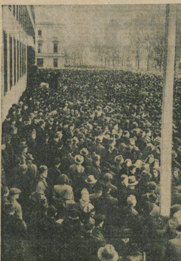
Une foule immense réclame la dénazification et un meilleur ravitaillement

Avec deux années de recul, on peut commencer à mesurer le bilan d'une expérience la plus extraordinaire de l'histoire : la grande lutte de 1944-1945 avait provoqué dans toute l'Europe une