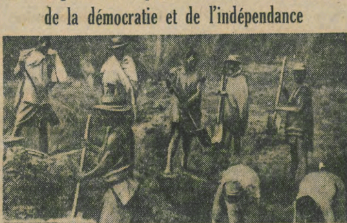
Ils en ont assez de travailler comme des bêtes...

Les événements de ces derniers jours ont mis à nu la crise politique qui fermentait depuis longtemps à Madagascar.