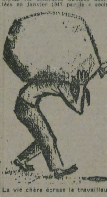
La vie chère écrase le travailleur.

LA SUPPRESSION des Crédits militaires LE CONTROLE OUVRIER sur les prix DES NATIONALISATIONS sans indemnités ni rachats