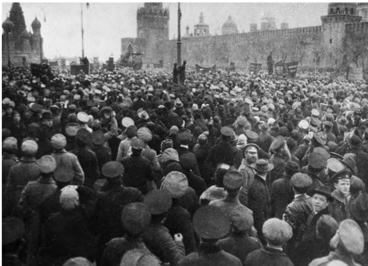
1 er mai 1917, Moscou.

Œuvres – t. 24 – pp. 40 à 45 Ed. Sociales – Paris Ed. du Progrès – Moscou - 1976