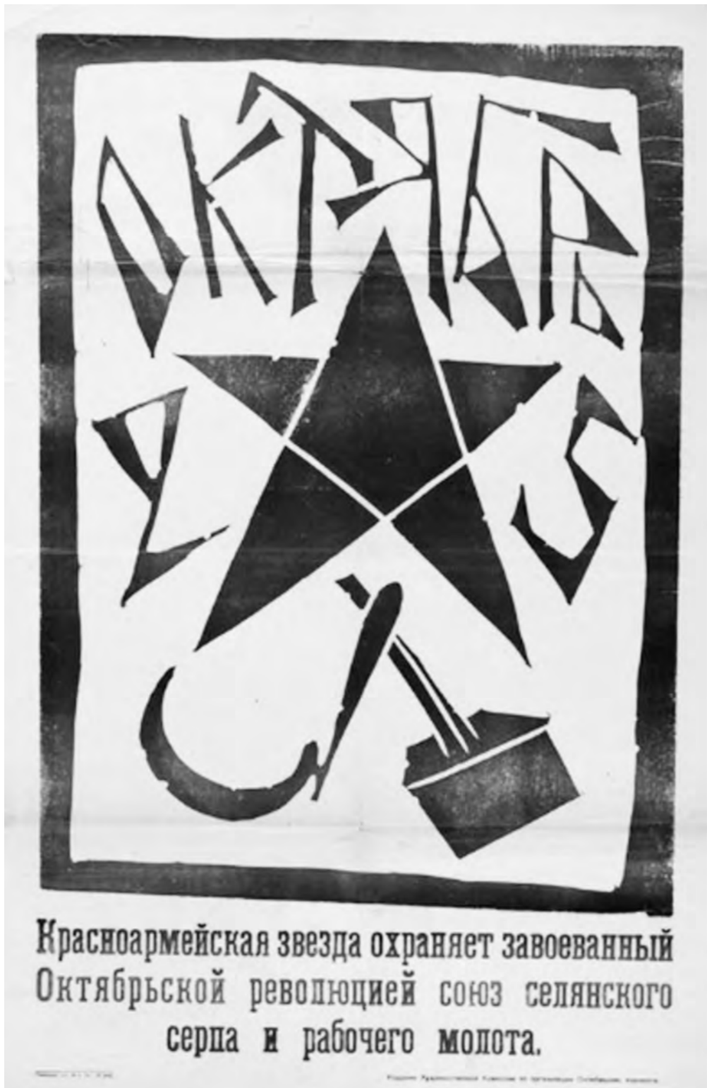
25 Octobre. La faucille du paysan et le marteau de l'ouvrier, l'étoile de l'armée rouge protège la victorieuse Révolution d'octobre.