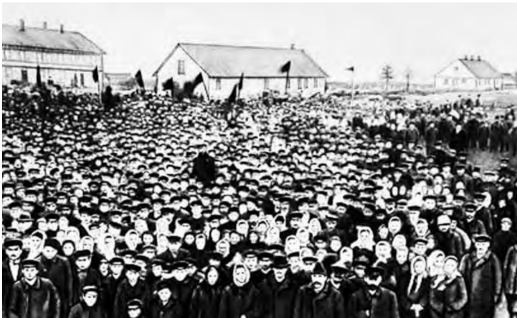
Grèves et manifestations se développent dans toute la Russie.