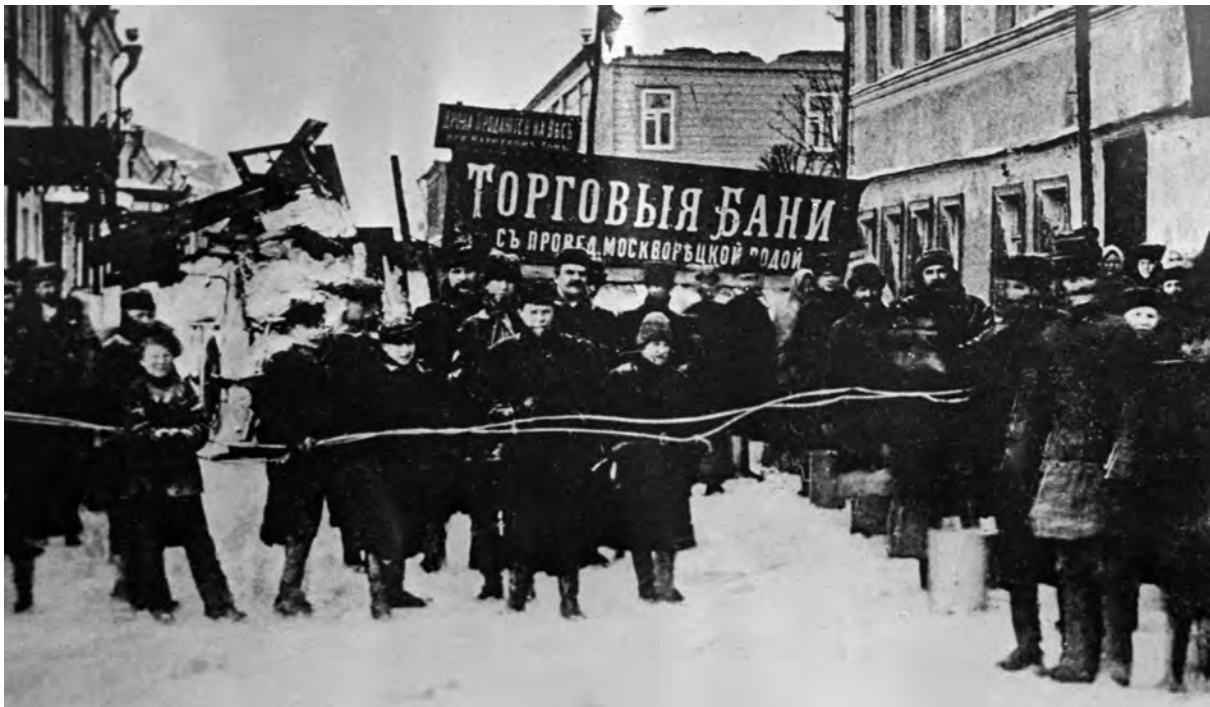
1905 : barricades à Moscou.