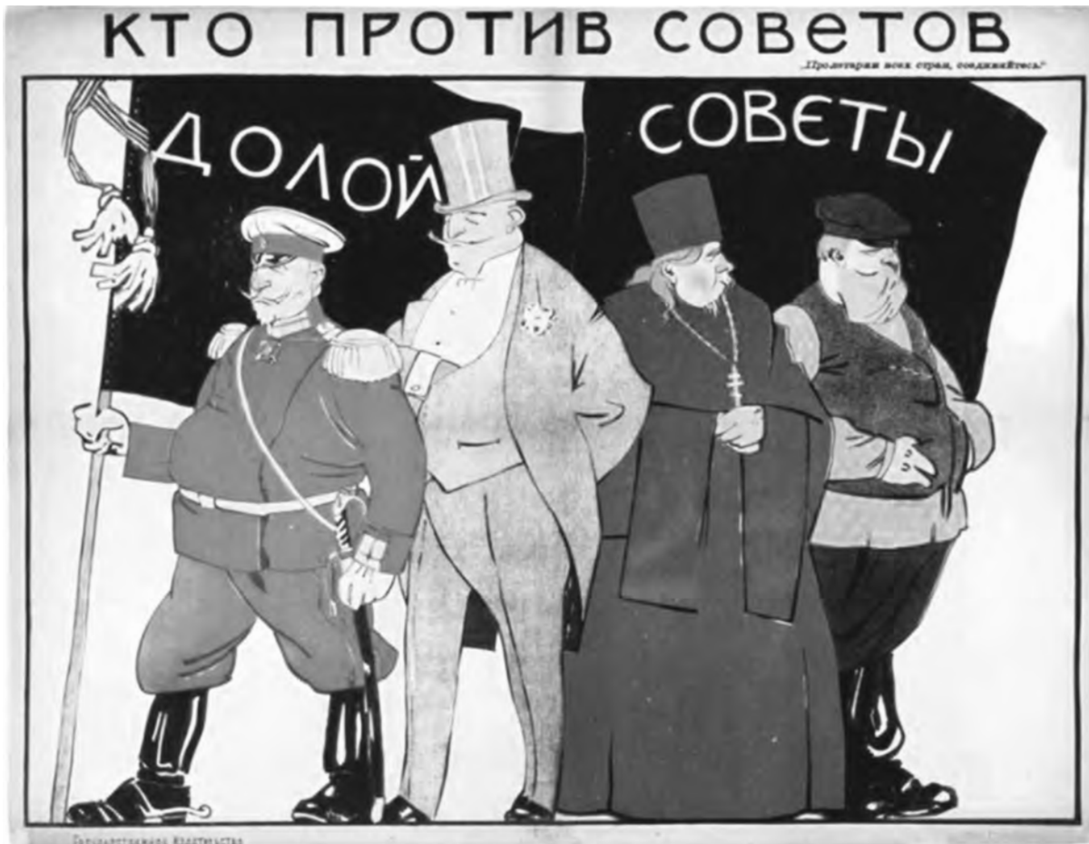
Ceux qui sont contre les soviets : les généraux, les capitalistes, le clergé et les koulaks qui brandissent un drapeau avec "A bas les soviets".