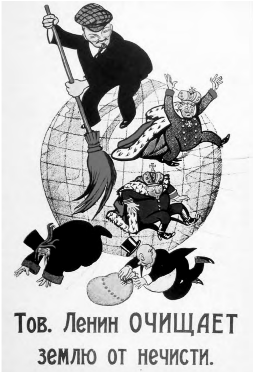
Le camarade Lénine débarrasse la terre des ordures.