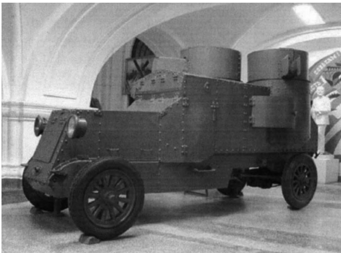
La voiture blindée de Lénine exposée au Musée d'histoire de l'artillerie militaire à Saint-Pétersbourg.

« Les soldats exigèrent que Lénine prît place sur une des autos blindées et il ne lui restait qu'à obéir. La nuit qui tombait donnait au cortège un caractère particulièrement imposant. Les feux des autres autos blindées étant éteints, les ténèbres étaient percées par la claire lumière du phare de la voiture sur laquelle roulait Lénine. La lumière projetée détachait de l'obscurité des rues des groupes agités d'ouvriers, de soldats, de matelots, de ceux-là mêmes qui avaient accompli la plus grande des insurrections, mais qui avaient laissé le pouvoir filer entre leurs doigts. La fanfare militaire dut cesser de jouer, plusieurs fois, en cours de route, pour donner à Lénine la possibilité de répéter, avec des variantes, le discours prononcé à la gare devant des auditeurs toujours nouveaux. »