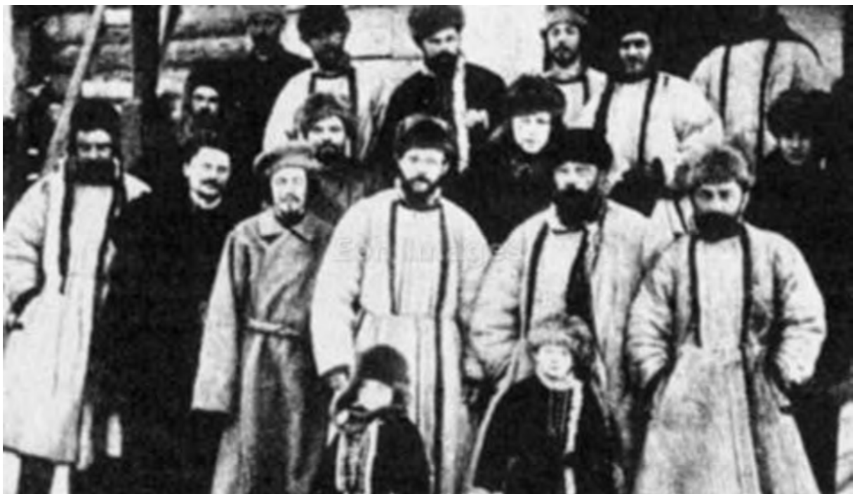
Les députés du soviét de Petrograd envoyé en Sibérie.

1905 – « Conclusions » – pp. 222 et suivantes. Ed. de Minuit – 1969