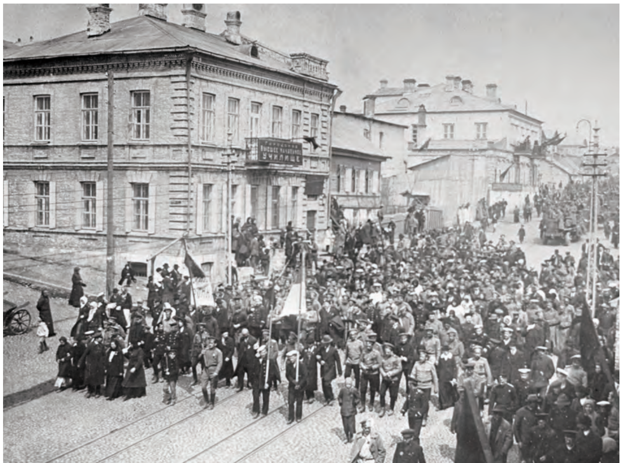
Février 1917 : manifestation à Vladivostok.