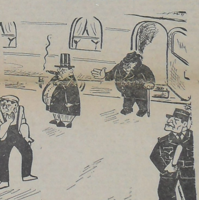
1953. - Front National Uni...

pendant qu'ils tireraient les cordons de sonnettes à Washington. Indépendamment des réactions à leurs partisans américains que nous examinons par ailleurs dans ces colonnes, les « autres ministres voyaient de loin leur hypothétique mort. Ils se disputaient bourgeois pour faire un grand pas de cause leur tombant alors que le Kremlin leur offre un Front National Uni à un prix plus avantageux que celui de Staline. Certes, le compromis est anonyme de