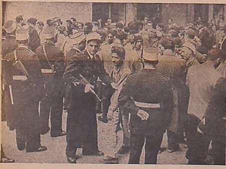
DIAGES DE LA « CHASSE AU FACIES »

Comment en est-on venu là ? se demandent les millions de travailleurs qui ont voté le 2 janvier 1956 pour la paix en Algérie, et qui ont écouté, le 25 janvier, Guy Mollet promettre la paix dans son discours d'investiture. Mais le 6 février, Guy Mollet capitulait devant l'émeute fasciste d'Alger. Mais le 11 mars — pas de loi — le Parlement, de Duclos à Pinay, votait les pouvoirs spéciaux. Et maintenant, c'est un bruit de boîtes qui domine la politique française. 200.000 hommes ! exige Robert Lacoste, ce digne successeur de Soustelle, ce digne porte-parole des colons, pour qui il n'est d'autre issue à la guerre d'Algérie que dans le massacre de musulmans par centaines de mille. Lacoste a raison ! proclame Edouard Herriot, le « vieux républicain » bien connu, président d'honneur de l'Assemblée Nationale et ex-président d'honneur de l'Union de la Jeunesse Républicaine de France — on peut être lésité encore ? car c'est un parti de 2.000.000 hommes ! — pour commencer, rétorque Guy Mollet, qui sait parfaitement que, de toute façon, agraire, à appliquer en Algérie, sur une opération de l'administration cessaires pour achever plus vite l'opération, ni des officiers nécessaires pour les encadrer, ni des casernes pour les recevoir. Après les réactions — et par la voix plus haute