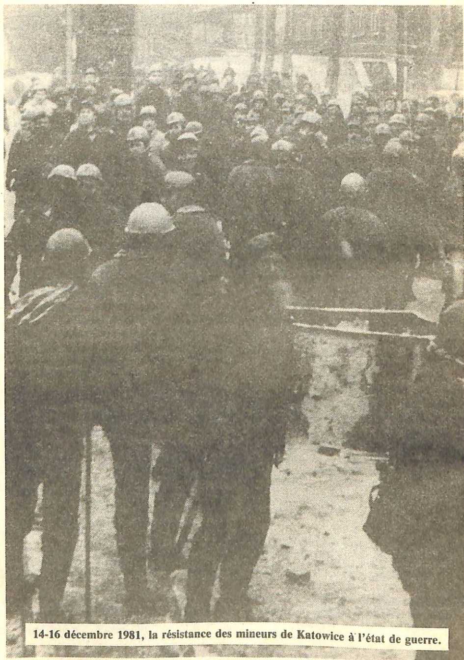
14-16 décembre 1981, la résistance des mineurs de Katowice à l'état de guerre.